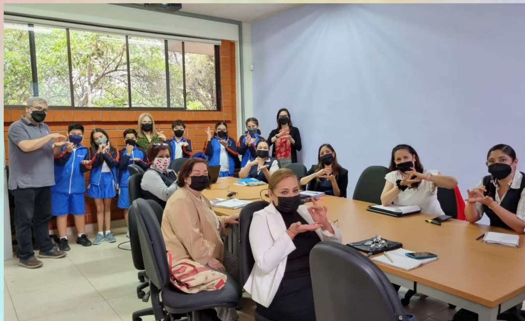
Inspectora y directoras de la zona