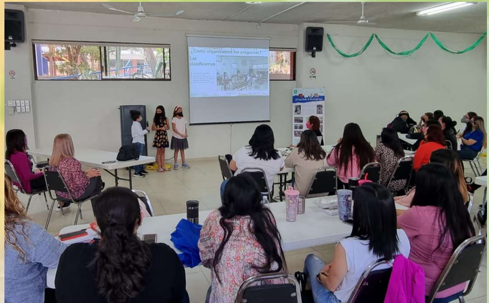
Junta de Consejo Técnico