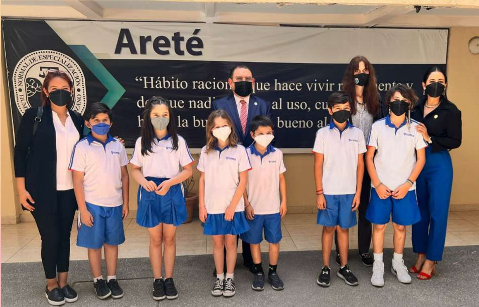
Normal de Especialización